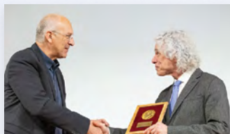
פרופ' סטיבן פינקר מקבל את מדליית דרווין מידי נשיא האקדמיה פרופ' דוד הראל

ההרצאה השנתית על שם צ'ארלס דרווין, המתקיימת זו השנה השנייה, נערכה בחודש מאי 2024. השנה נשא את ההרצאה הפסיכולוג הניסויי פרופ' סטיבן פינקר מאוניברסיטת הרווארד, בנושא The Evolution of Rationality and Irrationality . את האירוע הוביל יו"ר החטיבה למדעי הטבע פרופ' ידין דודאי. הבמה השנתית עוסקת בנושאי סביבה, אבולוציה, אקלים וביולוגיה.