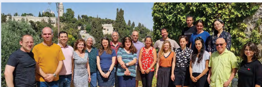
משתתפי כינוס "אקדמיקס"

עוד אחת מפעילויות הדגל של האקדמיה הצעירה היא סדרת הכינוסים " אקדמיקס " - מפגשים בין-תחומיים המיועדים לסגל אקדמי בכיר ממוסדות שונים בארץ, שמטרתם קידום שיתופי פעולה בין-תחומיים, הרחבת קשרי המחקר והעבודה וגם מתן פינה שקטה לחוקרים לעבודתם. השנה היה גם מפגש ייעודי לדוקטורנטים וכן כינוס בפורמט דומה, "אקדמיקס גרמניה", שהתקיים בחודש מאי 2024 בברלין, והשתתפו בו חברים באקדמיה הישראלית ובאקדמיה הגרמנית.