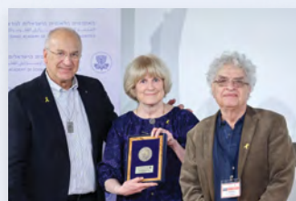
מימין: יו"ר החטיבה למדעי הטבע פרופ' ידין דודאי, פרופ' מארי־קלייר קינג ונשיא האקדמיה פרופ' דוד הראל

פרופ' מארי־קלייר קינג, פרופסור מטעם האגודה האמריקאית לסרטן במחלקות למדעי הגנום ולרפואה באוניברסיטת ושינגטון שבסיאטל, נשאה בחודש נובמבר 2024 את הרצאת איינשטיין . פרופ' קינג היא חוקרת פורצת דרך שזכתה להכרה בין־לאומית בעקבות גילוי גן ה־BRCA1. הרצאתה עסקה בשיטה שפיתחה לזיהוי גנטי של ילדים שנחטפו בתקופת המשטר הצבאי בארגנטינה, מה שאפשר לרבים מהם להתאחד עם משפחותיהם לאחר שנים ארוכות.