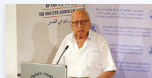
פרופ' דן מירון בהרצאתו "גלגולו של גלגול"

בחודש יולי הושקה, ביוזמת נשיא האקדמיה פרופ' דוד הראל, סדרת הרצאות חדשה - "הרצאות מבית". את הרצאות הסדרה נושאים חברי וחברות האקדמיה - כל אחד בתחום מחקרו. את ההרצאה הראשונה, "גלגולו של גלגול, או: המטמורפוזה הבלתי גמורה" לציון מאה שנה לפטירתו של פרנץ קפקא, נשא חבר האקדמיה פרופ' דן מירון בחודש יולי 2024. את ההרצאה השנייה בסדרה, "נח בשבע שגיאות ועוד: עברית וידיש, שתי לשונות לחברה אחת" , נשאה חברת האקדמיה פרופ' חוה טורניאנסקי בספטמבר 2024. ההרצאה השלישית בסדרה, מפי חבר האקדמיה פרופ' דניאל פרידמן, "המשבר המשפטי בדמוקרטיה ליברלית" , התקיימה בדצמבר 2024.