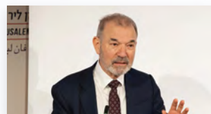
פרופ' סטיבן גרינבלט נושא את ההרצאה השנתית על שם מרטין בובר

פרופ' סטיבן גרינבלט מאוניברסיטת הרווארד נשא בחודש פברואר 2024 את ההרצאה השנתית על שם נשיאה הראשון של האקדמיה פרופ' מרטין בובר. פרופ' גרינבלט הוא מן הבולטים שבחוקרי שייקספיר, והרצאתו עסקה בנושא Shakespeare's Second Chance . את האירוע הובילה נשיאת האקדמיה לשעבר פרופ' נילי כהן.