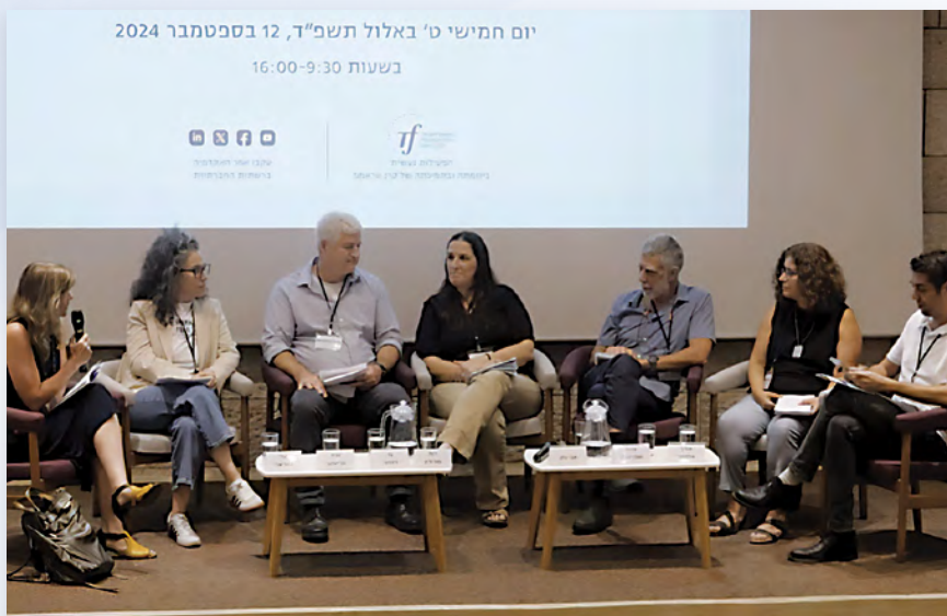
משתתפי הדיון "חשיבה חישובית פוגשת את השדה: תובנות מהשטח" בכינוס בנושא חשיבה חישובית

בחודש ספטמבר 2024 ערכה ועדת מומחים של האקדמיה יום עיון שעסק בסוגיות מהותיות בנוגע ל חשיבה חישובית ולהכשרת דור העתיד בתחום הבינה המלאכותית. באירוע השתתפו חוקרים ואנשי חינוך רבים. בראש הוועדה עומדת פרופ' מיכל ארמוני ממכון ויצמן למדע.