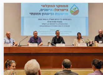
רב-שיח בכינוס "המחקר החקלאי בישראל"

בחודש מאי 2024 התקיים, בשיתוף פעולה עם האקדמיה הלאומית ומכון וולקני, כינוס בנושא המחקר החקלאי בישראל: הישגים, חדשנות וביטחון תזונתי . מטרת הכינוס הייתה להציג את המחקר ואת הטכנולוגיה החקלאיים בישראל ואת חשיבותם המדעית-כלכלית-ביטחונית. את הכינוס הוביל הוועד המנהל של האקדמיה הצעירה, ועימו פרופ' אבי צדוק ופרופ' אילון שני, בוגרי האקדמיה הצעירה, בשיתוף פרופ' ידן דודאי, יו"ר החטיבה למדעי הטבע של האקדמיה הלאומית.