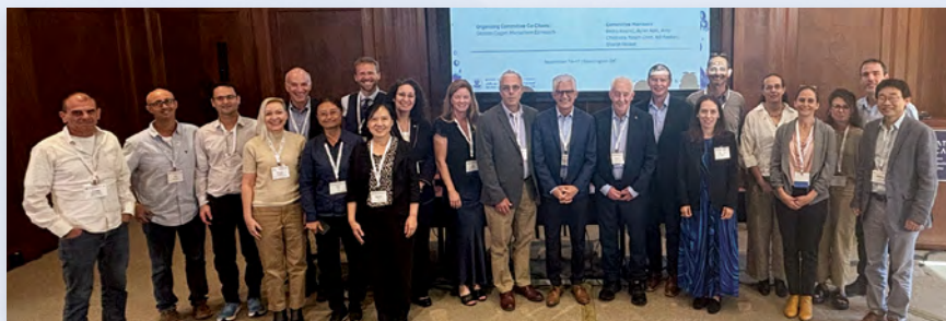
משתתפי הכינוס המשותף עם האקדמיה הלאומית של ארצות הברית בנושא התמודדות עם מחסור המים העולמי